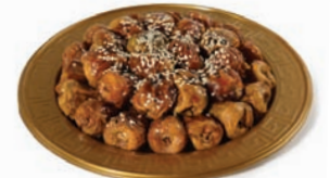
Sukkari with almond سكربي محشي باللوز