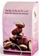
Dates with almond and chocolate تمر باللوز والشوكولا