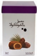
Ma'amoul coated chocolate معمول بالشوكولا