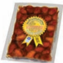
Khalas al Chouyoukh خلاص الشيوخ