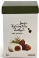
Ma'amoul coated white chocolate معمول بالشوكولا الابيض