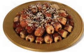
Segae with almond صقعي محشي باللوز