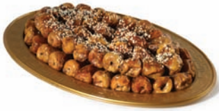
Sukkari with almond سكربي محشي باللوز