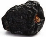
Ajwa al Madina عجوة المدينة