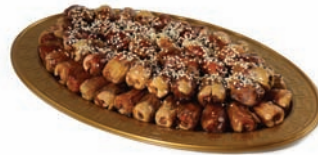
Segae with almond صقعي محشي باللوز